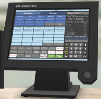
DURATEC POS S15

Immer eine gute Wahl: professionelle, stationäre Kassen von Duratec. Alle Modelle sind flexibel, intuitiv zu bedienen und das zu einem äußerst fairen Preis.