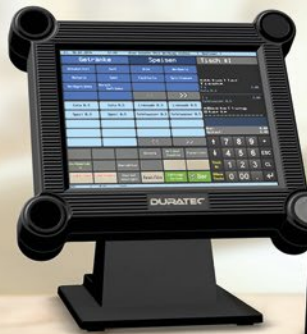
DURATEC POS S12