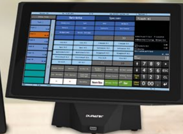
DURATEC POS S14