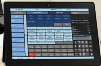
DURATEC POS PC